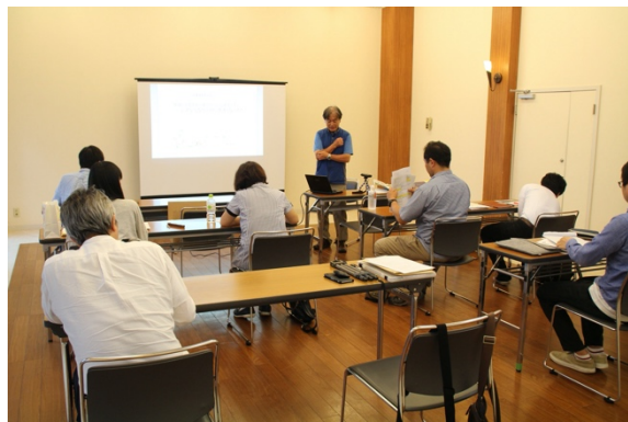
レクチャーの様子