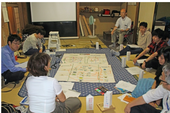
ラウンドテーブルの様子

14:30～17:00 ラウンドテーブル：「福島県における自然学校の現状と課題」